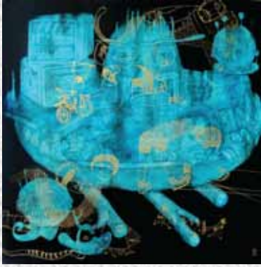
Old Stock Fresh Menu โดย Antonius Subiyanto, รางวัลชนะเลิศ UOB Southeast Asian Painting of the Year และรางวัลชนะเลิศ UOB Painting of the Year ประเทศอินโดนีเซีย ปี 2557